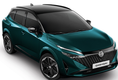
QASHQAI J12A e-POWER 190 KM AT 2WD

Poniżej znajdziesz wycenę wybranego przez Ciebie pojazdu. W razie pytań prosimy o kontakt.