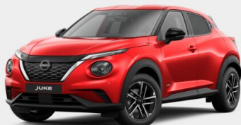
JUKE F16B 1.0 DIG-T 114 KM AT 2WD

Poniżej znajdziesz wycenę wybranego przez Ciebie pojazdu. W razie pytań prosimy o kontakt.